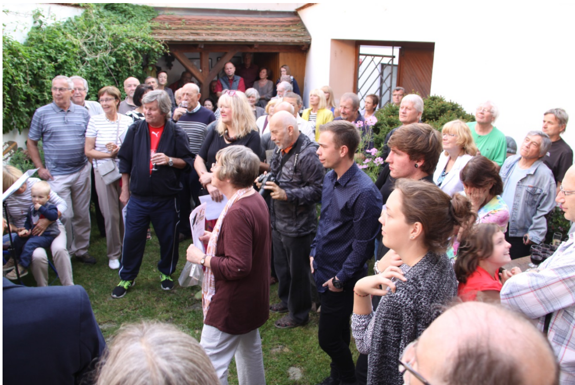
Většina návštěvníků vernisáže patřila ke Štěpánovým přátelům.