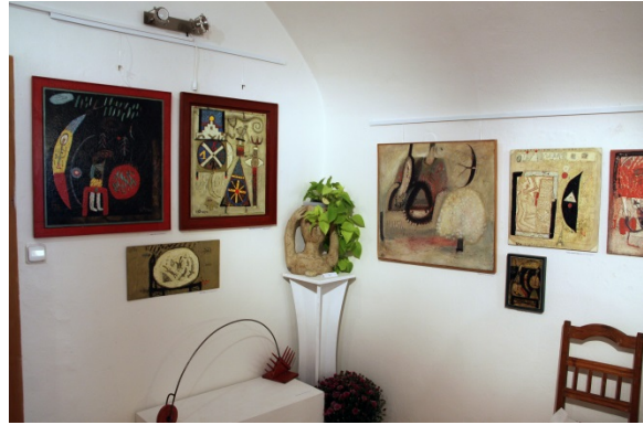
Snímky z instalace výstavy